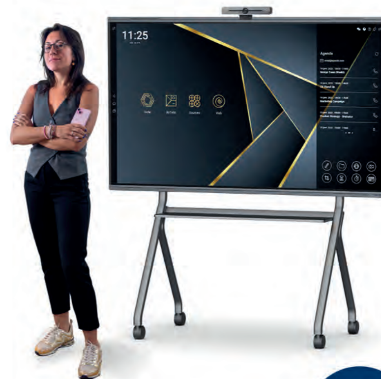
Tableau interactif Pro Connect Speechi

- «Solex»: Donneschdeg, de 25.06.2026 vu 16.00 bis 18.00 Auer zu Helfant (D) (an deen, deen net weess, wat dat ass, majo da googelt mol schéin)